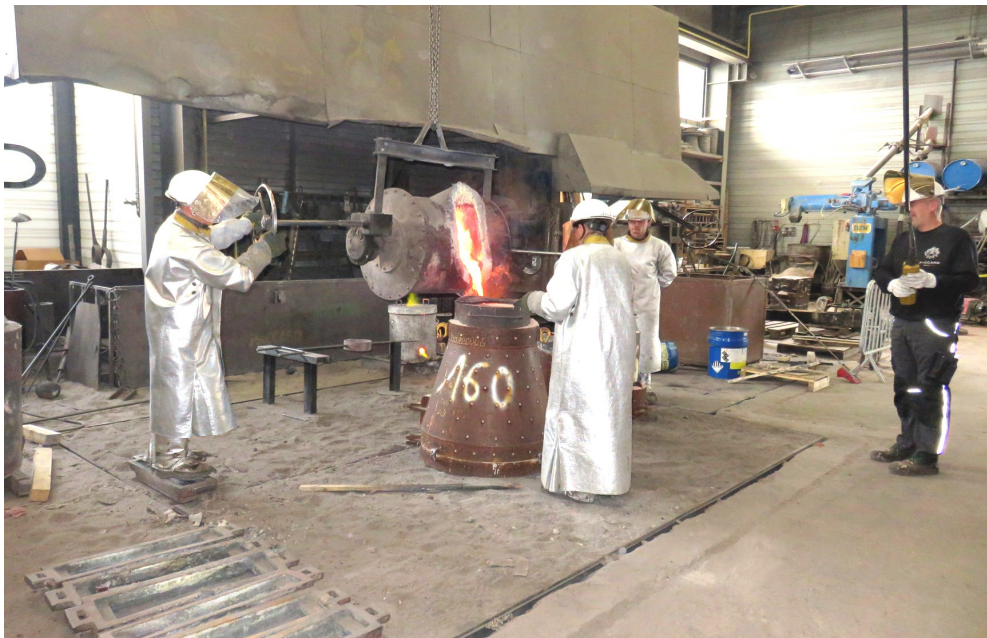
Le bronze est versé dans le moule