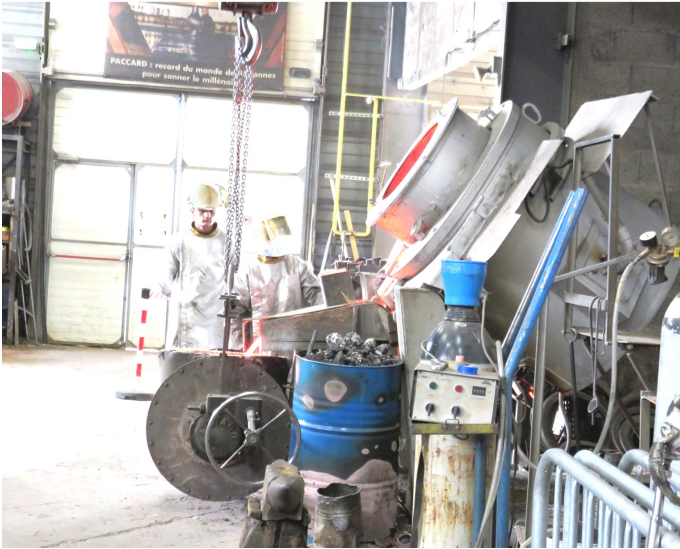
Le bronze en fusion est extrait du four