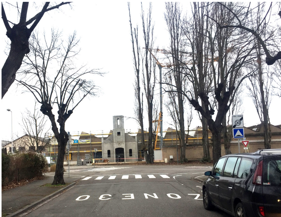
La perspective depuis la rue de la Soie, dégagée par l'abattage du mur de clôture