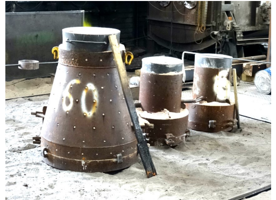
Le moule de la future cloche