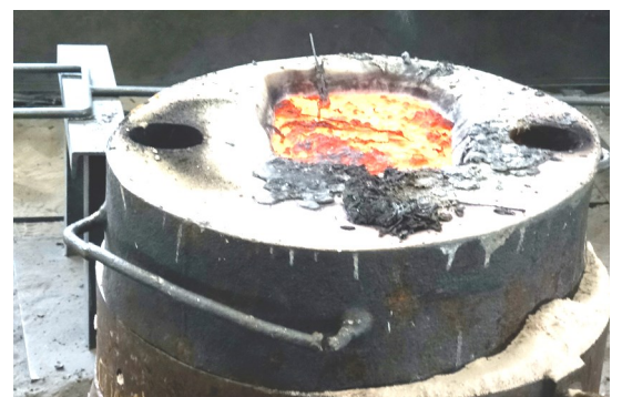
Ci-dessus : refroidissement de la cloche