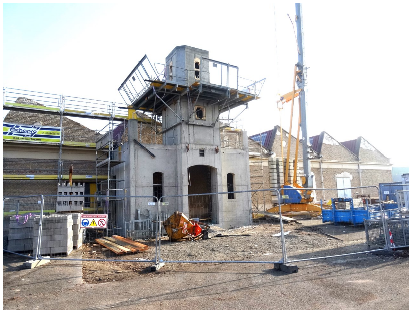
Construction de la chambre des cloches