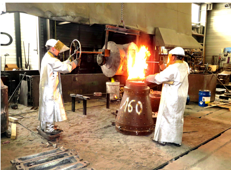
A gauche : les gaz échappés du moule sont enflammés