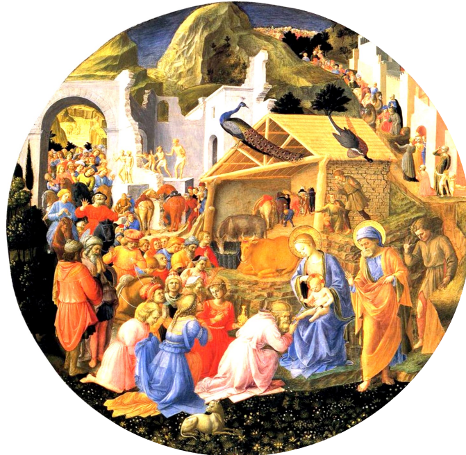
Filippo Lippi, Adoration des Mages

Alors, face à la vieillesse du monde appelé « nouveau » par les nouveaux socialistes en marche, face à la vieillesse de la théologie faussement nouvelle de Vatican II, face à la vieillesse de la « nouvelle » messe du siècle dernier, le dossier spirituel du pèlerinage nous invitera à proclamer et à montrer que NOUS SOMMES LA JEUNESSE DE DIEU.