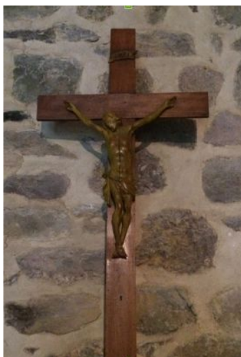
Croix sculptée par saint Louis-Marie Grignon de Montfort

Nous qui bénéficions de moyens de locomotion plus rapides et plus confortables, nous sommes heureux de pouvoir nous unir à ces nombreux saints pour qui les longues pérégrinations ont été un moyen efficace de sanctification.